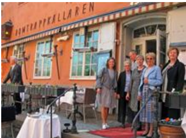
Förväntansfulla deltagare på Domtrappkällaren inför lunchen

37 medlemmar från EskilstunaSenioruniversitetet for 27 april till Uppsala och OD:s Vårkonsert i strålande försommargrönka. Före konserten serverades en god lunch på Restaurang Domtrappkällan och så en kort promenad backen upp till universitetsaulan där konserten hölls. Programmet inleddes med att publiken tillsammans med Orphei Drängar sjöng Kungssången eftersom kungaparet var närvarande vid konserten. Operasångerskan Christina Nilsson var dagens gäst och framförde arior av Puccini, Wagner och Verdi. På körens repertoar fanns också stycken av Schubert, Schumann, Max Reger och Bela Bartok samt både svenska och ungerska folkvisor. Därutöver sjöng kören förstås ett knippe vårsånger. Publiken klappade in både kör och solist till flera extra nummer som tack för en fantastiskt fin konsert kryddad med kunglig glans.