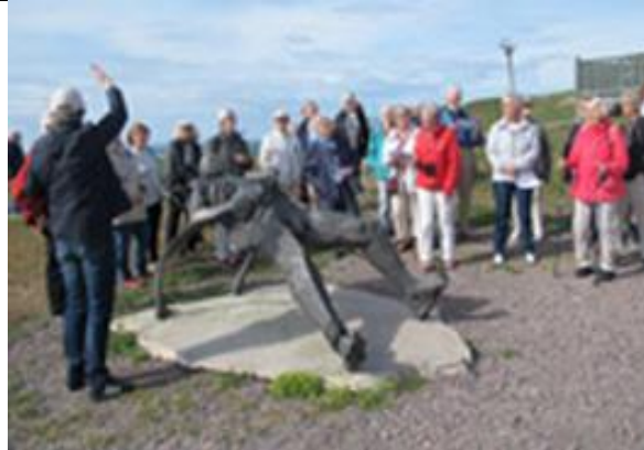
Konst på hög - Kvarntorp