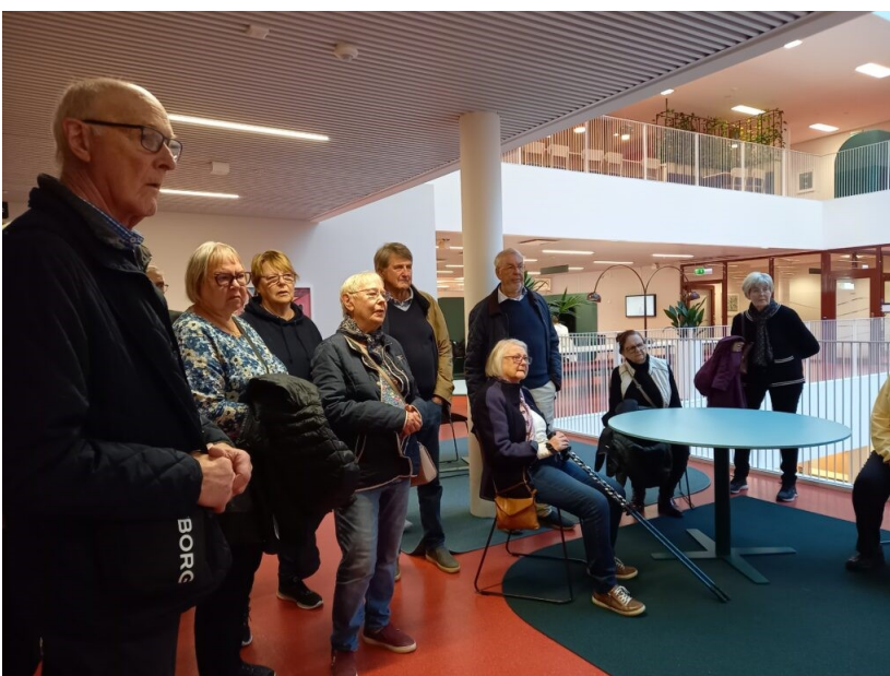
Nöjda studiebesökare tyckte det var intressant att få göra en rundvandring i universitetets nya lokaler och få veta mera om verksamheten som bedrivs här.